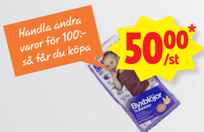
Blöjor, ICA Handla andra varor för 100:- så får ni köpa Blöjor för 50:- /st

Onsdag v.15 kl 11-14 säljer vi butikslagade Langos utanför butiken.