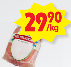
Helgskinka Nybergs deli, kokt. Max 2 köp/hushåll