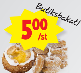
Wienerbröd, munkar, småbröd Butiksbakat