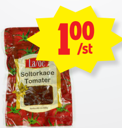
Soltorkade tomater Soltorkade tomater, Laroc. 100g, Max 5st/kund

MÅN-FRE 7-21 LÖR-SÖN 8-21 Tel. 0951-266 90