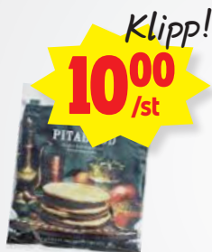
Pitabröd, ICA 480g