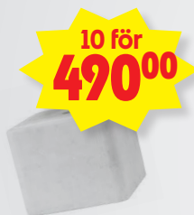
Saltsten Ord. pris 59.90:-/st (gäller så långt lagret räcker)

- Beställ våra populära matkassar. Goda och enkla recept